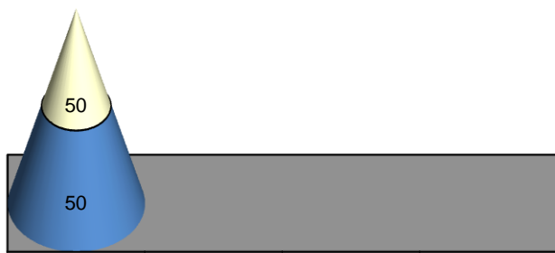
Таблица 1. Сравнительная таблица уровня образования педагогов

Реализация основной образовательной программы дошкольного образования Учреждения обеспечивается педагогическими кадрами, имеющими высшее образование – 3 чел./50%, среднее профессиональное образование – 3 чел./50%.